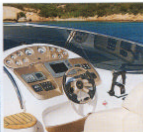
A sinistra, il C35 in rada. Sopra, la console della barca e, alla sua sinistra, il gradino per accedere al ponte di prua passando per l'apertura del parabrezza