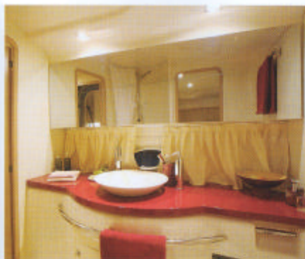
Sopra, il bagno con il suo lavello molto originale e il bel piano d'appoggio. A lato, l'angolo cucina con il lavello ovale e il piano di lavoro in inox. Sotto, la cabina di poppa