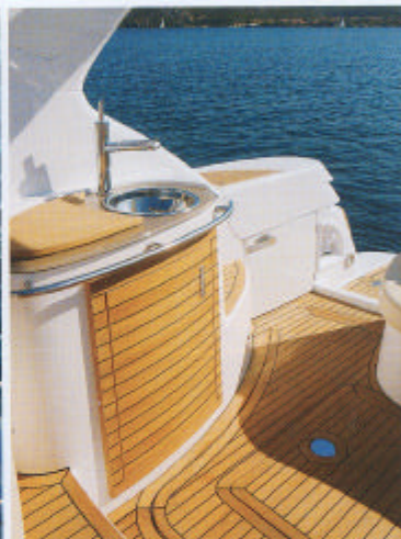
A sinistra, una vista del pozzetto. Sopra, il mobile cucina esterno. Sotto, il C35 in virata, dove ben si vede la V profonda di prua

valore della barca sul mercato dell'usato.